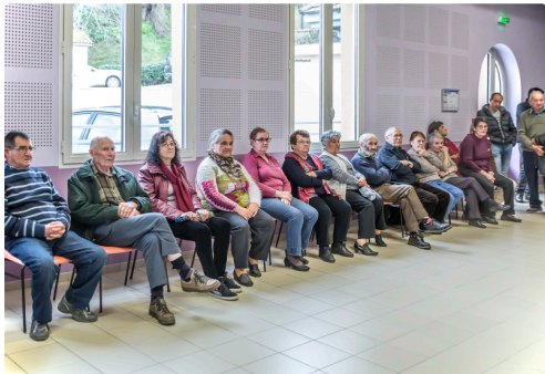
Autre vue de l'assistance