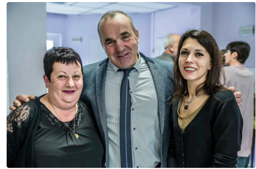
Le maire avec l'ancienne et la nouvelle secrétaire