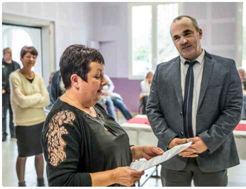
Elle prend la parole