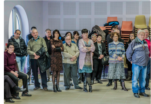
Autre vue de l'assistance