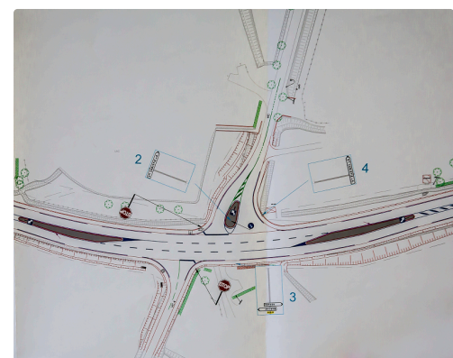
Plan des travaux d'aménagement du carrefour de la RD 931 avec la voie du village