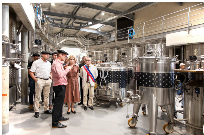
Plus loin dans l'atelier des cépages