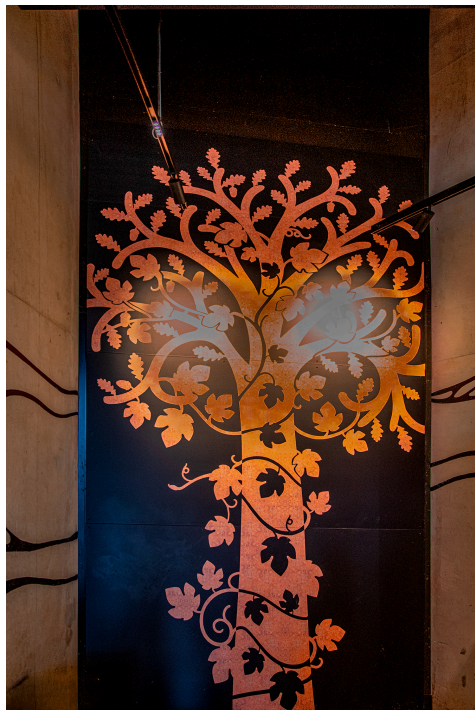
La lambrusque flamboyante

Ensuite, la ministre entre dans l'atelier des cépages proprement dit et se fait expliquer le travail qui y est effectué.