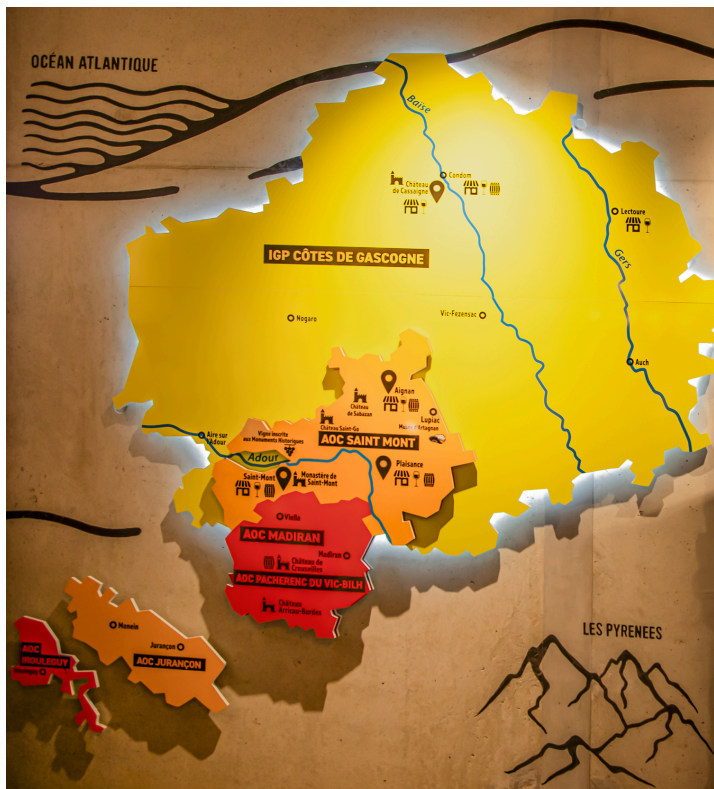
Carte des AOC et IGP