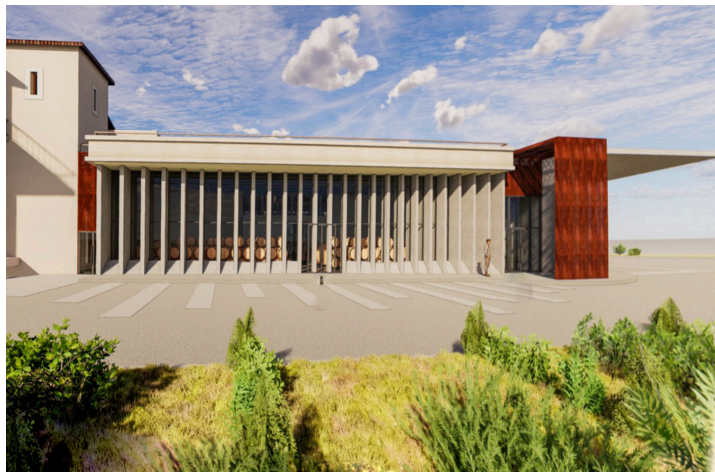
Façade de l'Atelier des cépages

La visite commence par le vestibule, dédié à l'œnotourisme, où la ministre coupe le ruban de l'inauguration.