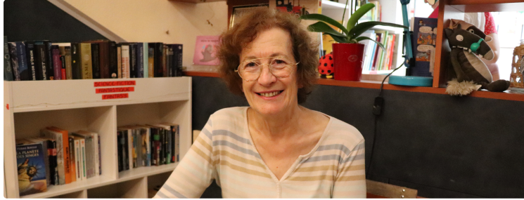
Astarac, l'âme paysanne