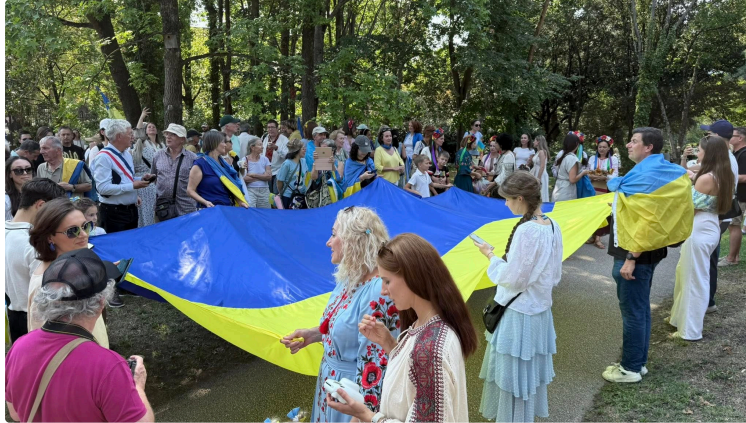
A Toulouse, les 34 ans d'indépendance de l'État d'Ukraine

A Toulouse, comme dans les grandes villes française des rassemblement ont eu lieu pour fêter les 34 ans de l'indépendance de l'Ukraine.