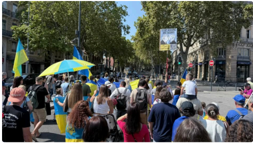
Rassemblement à Toulouse