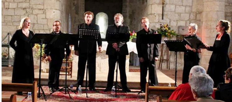
Le chœur Excelsis en concert.

Après le concert de qualité de musique classique exécuté par la formation « la clef des champs » qui a eu un succès retentissant en mai 2025, l'association « les Amis de l'église St Pierre de l'Isle-de-Noé » organise samedi 6 septembre à 20h dans l'église du village, une soirée musicale animée par le chœur Excelsis .