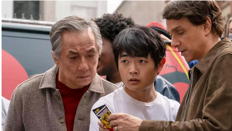
Cinequanon : on profite encore des vacances !

Encore quelques jours de vacances avec un programme pour tous les âges !