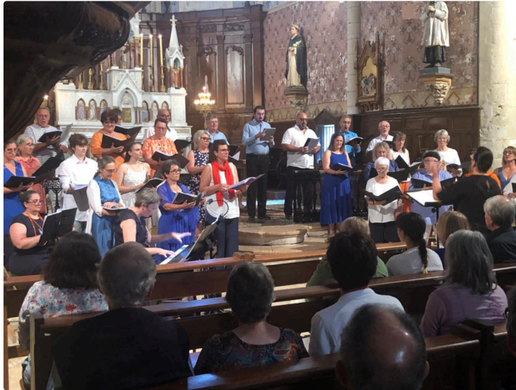
Triomphe retentissant dans l'église