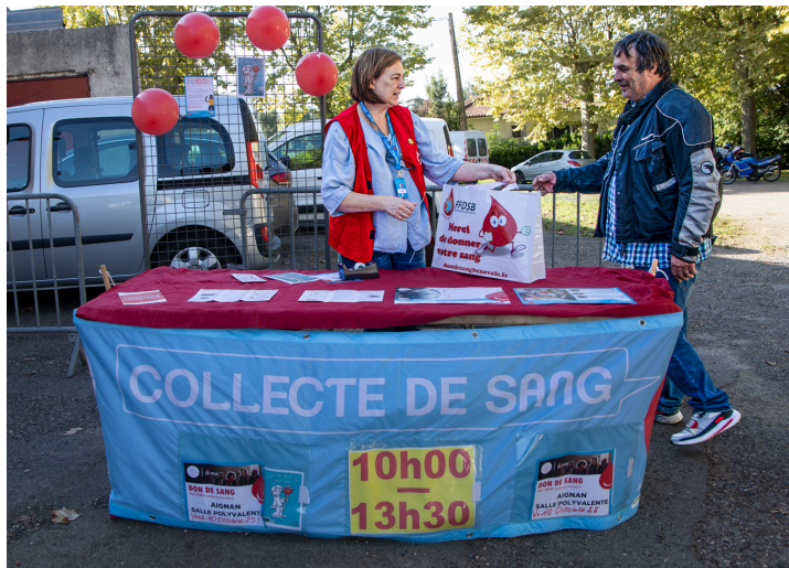
Stand de Don du sang Nogaro Aignan (DSNA) et annonce d'une collecte de sang le matin du 10 octobre 2025