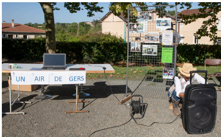
Stand de Un Air de Gers, qui organise des spectacles musicaux

Stand d'Aignan Patrimoine ; cette association travaille à restaurer les édifices remarquables ; notamment l'église de Fromentas : la Direction régionale des affaires culturelles, dans un courrier daté du 06.08.2025, annonce qu'elle subventionnera à 40% une étude visant à actualiser le diagnostic et à 50% les travaux qui en découleront.