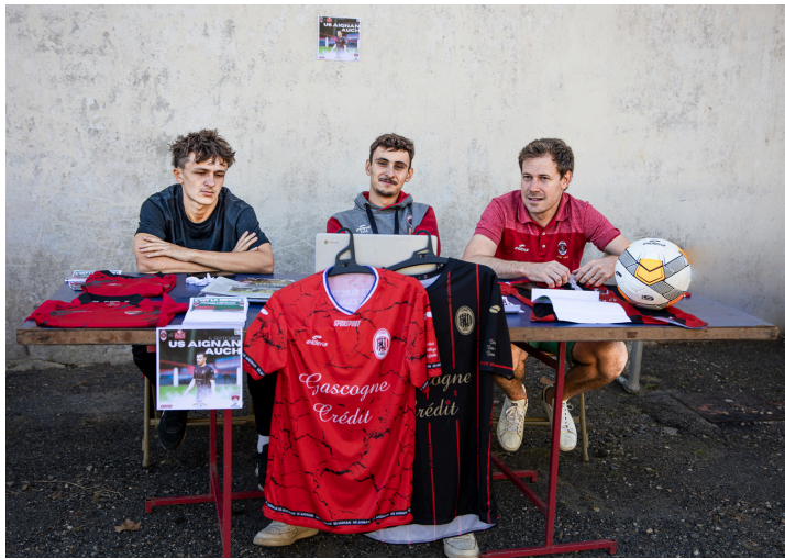
Le football avec l'Union Sportive Aignanaise