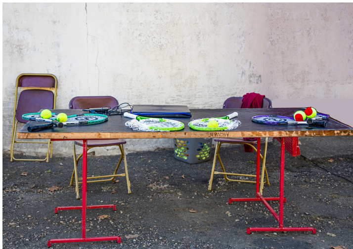
Stand du club de tennis