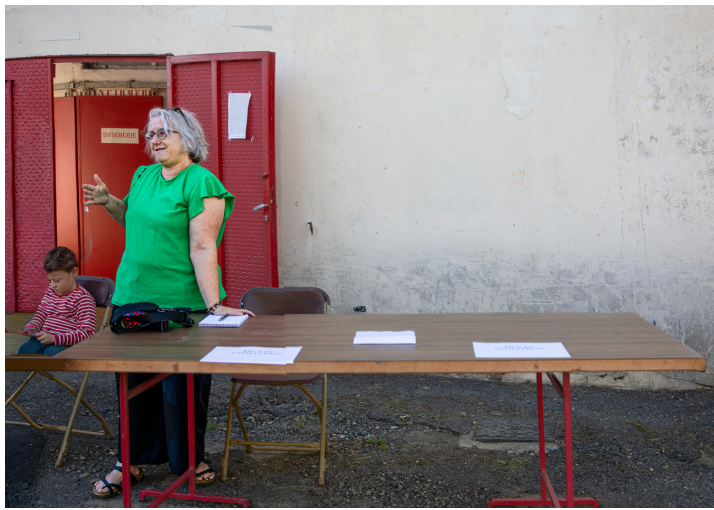
Aignan Animation (Organisation d'animations dans la commune d'Aignan)