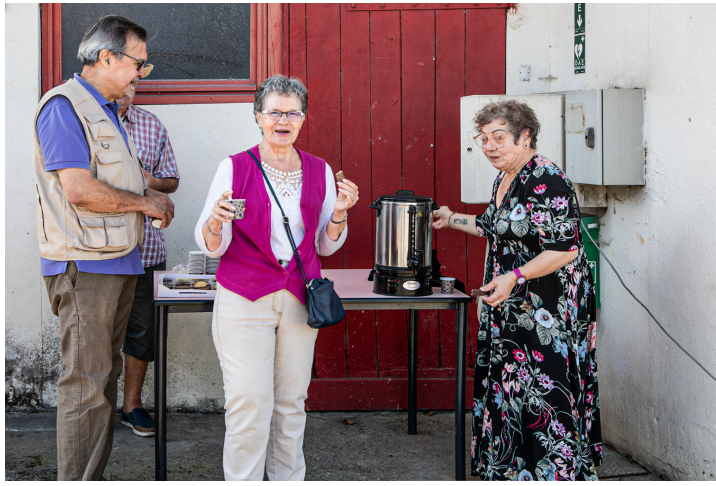
Le coin café