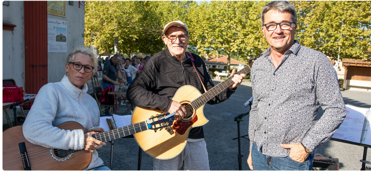
Aignan : les associations se présentent

Elles proposent une grande variété d'activités