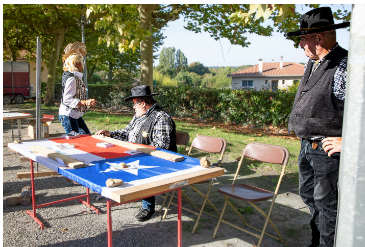
Stand de Carchet City, le village western qui présente ses cow-boys, son saloon, ses cavalcades etc.