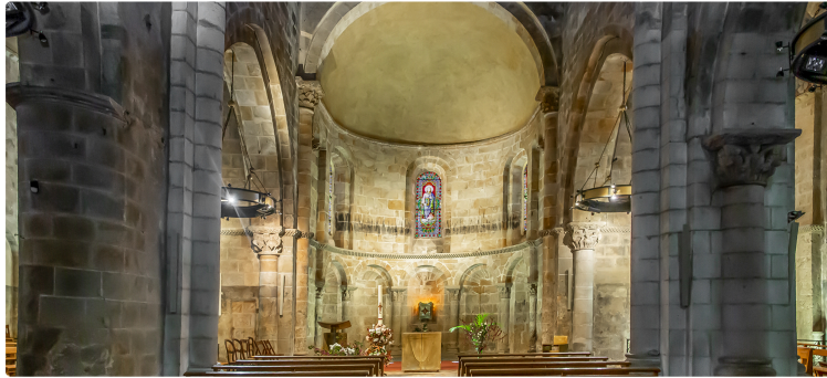
Nogariens, connaissez-vous votre église, qui date du XIe siècle ?

Avec Ancore, visitez la collégiale Saint-Nicolas les 20 et 21 septembre