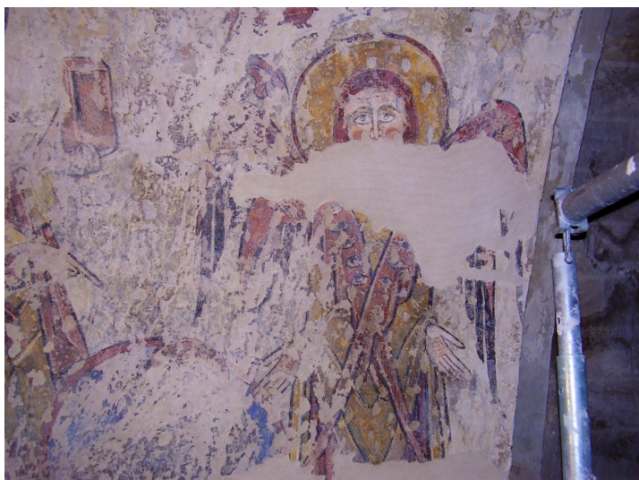
Fresque représentant un ange