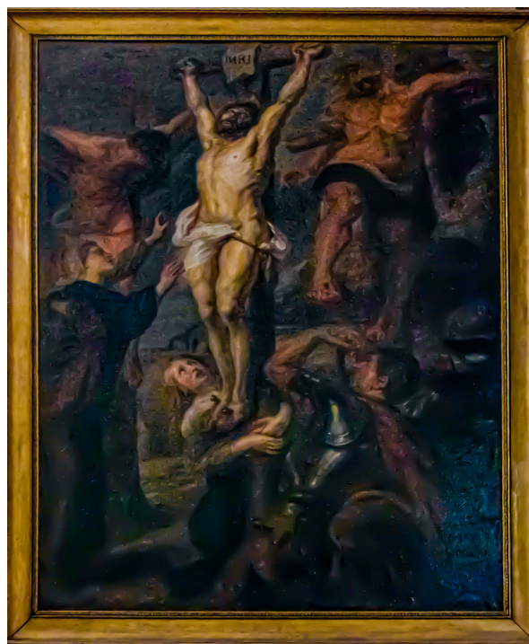
Tableau représentant le Christ en croix