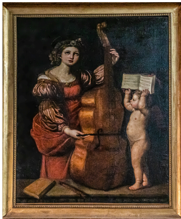
Tableau représentant une sainte musicienne