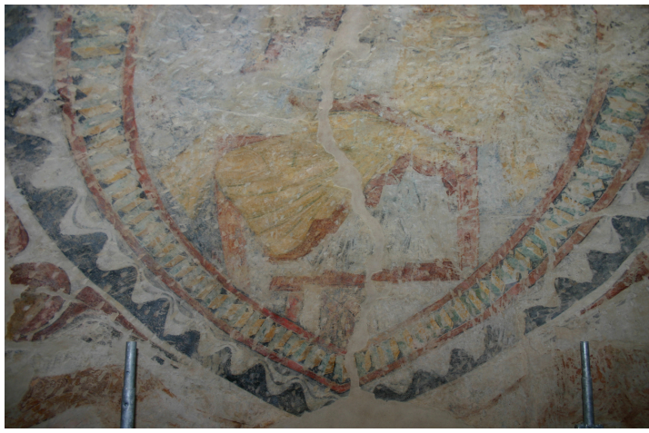
Détail de la fresque sur la voûte de l'absidiole ouest