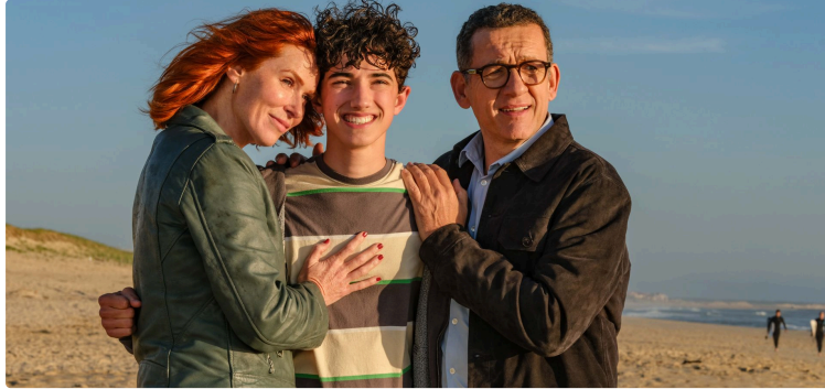
Cinquanton : rediffusions et nouveautés cette semaine

Cette semaine, rediffusion de films qui ont marqué la rentrée pour ceux qui les auraient ratés et des nouveautés !