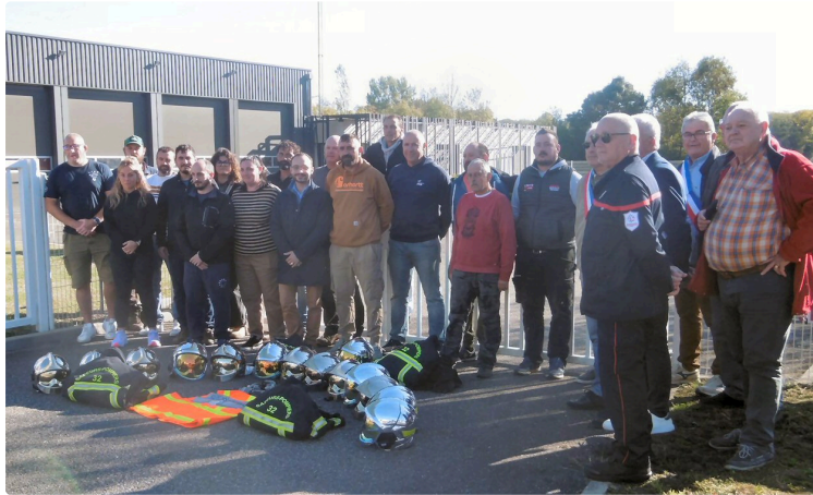
Les pompiers dans la grogne

trop de revendications restées sans réponse