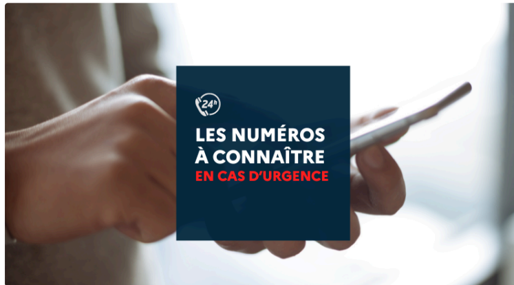
Des numéros à connaître pour bien réagir en cas d'urgence

La CPTS (Communauté Professionnelle Territoriale de Santé) Gascogne Armagnac communique :