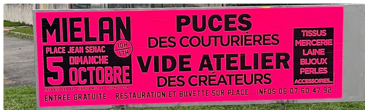
Puces des couturières, dédicaces

Dimanche 5 octobre, les couverts de la place Jean Sénac à Miélan seront très animés, grâce à l'association Animation Arts & Terroir Miélan.