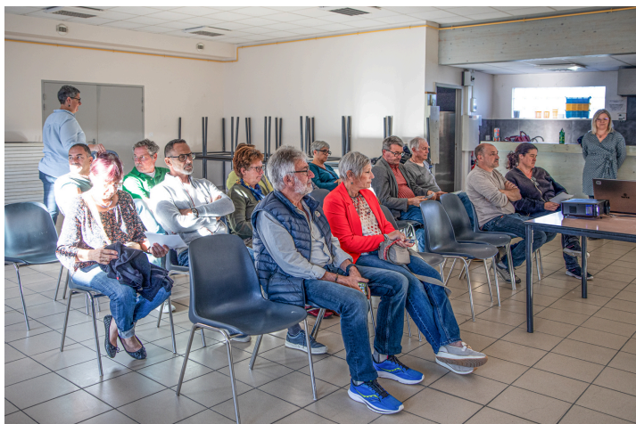
L'assistance, parmi laquelle les maires d'Aignan, Bouzon-Gellenave et Sabazan

De plus, l'OT explique l'objectif de la collecte de la taxe de séjour, qui vise – uniquement – à développer le tourisme local.