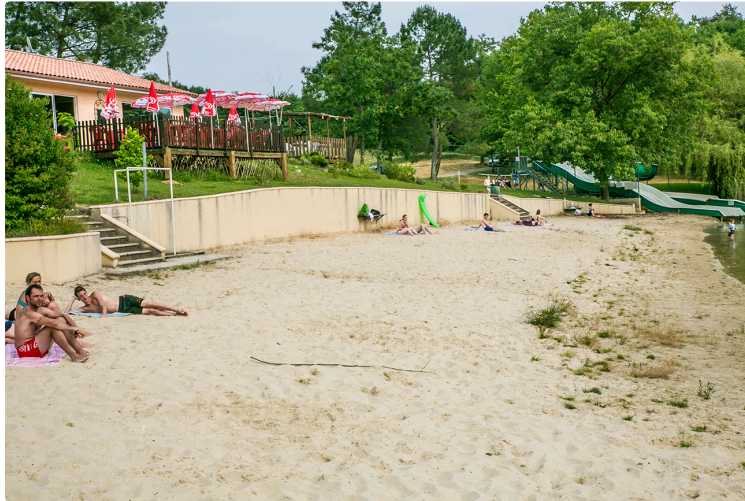
Aignan : données de l'OT Cœur Sud-Ouest sur l'hébergement touristique