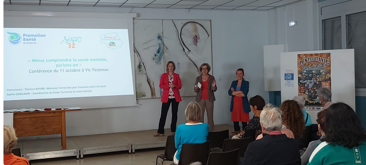
"Mieux comprendre la santé mentale : parlons-en", une conférence pleine d'enseignement proposée par La Bienfaisance

L'association La Bienfaisance proposait samedi 11 octobre à la mairie de Vic-Fezensac une conférence sur la Santé Mentale " Mieux comprendre la santé mentale: parlons-en"