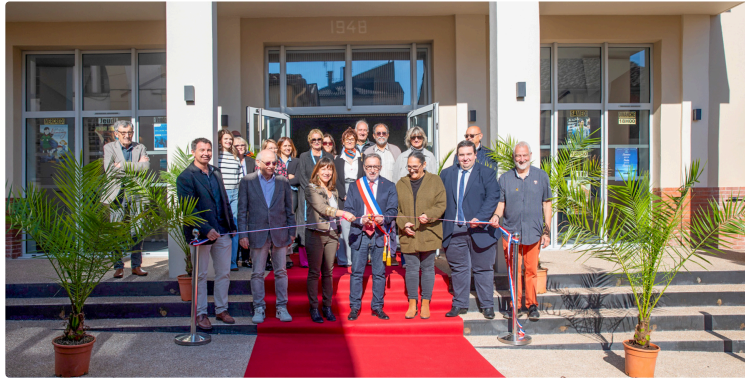
Nogaro : le cinéma-théâtre superbement rénové

L'inauguration a eu lieu le 15 octobre 2025