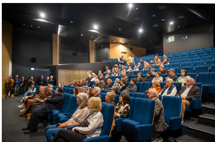
Autre vue de la salle