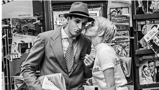
Cinequanon : la programmation de la rentrée !

C'est la rentrée ! Votre cinéma vous attend pour vos soirées d'automne !