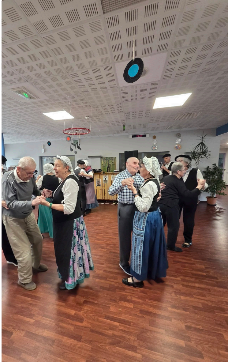
EHPAD de l'hôpital : rejoignez l'équipe des bénévoles !

À l'EHPAD de l'hôpital de Vic-Fezensac, l'animation occupe une place essentielle dans la vie quotidienne des résidents. Elle contribue à préserver leur bien-être, leur autonomie et surtout, le lien social si précieux au sein de la structure.