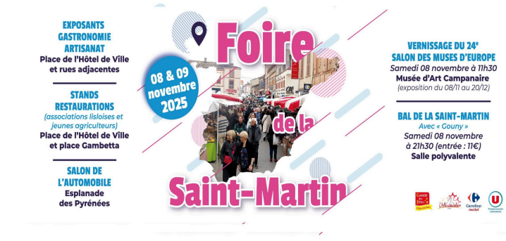
48 e Foire de la Saint-Martin : une tradition vivante et conviviale