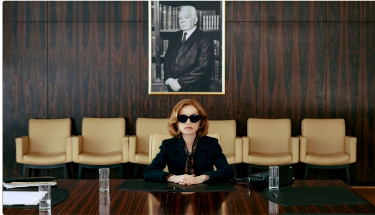
Cinequanon : animation, thriller, comédie et drame au programme

A noter cette semaine, le dernier film avec Isabelle Huppert et Laurent Lafitte et le dernier François Ozon avec Benjamin Voisin.