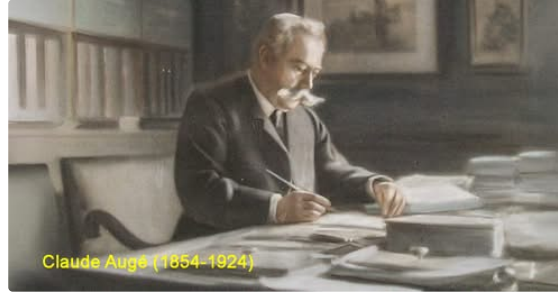
23ème édition, la dictée de Claude Augé séduit toutes les générations ce samedi 15 novembre 2025