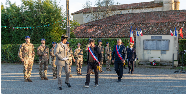
Commémoration de l'Armistice de 1918