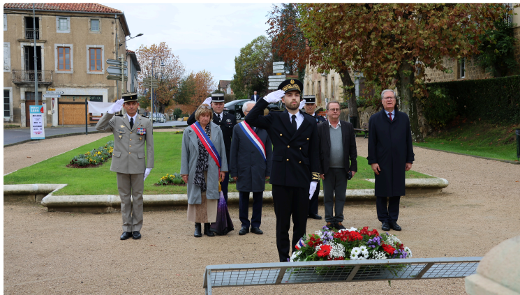
Présentation de Clément Frézet, sous-préfet de Mirande

Clément Frézet, 29 ans, juriste de formation, j'ai fait mes études à l'université de Bordeaux qui est ma ville d'origine, à la faculté de droit durant cinq années.