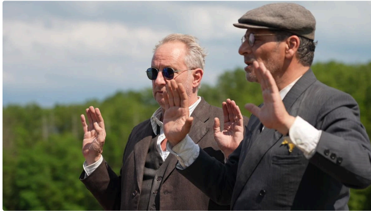
Cinequanon : animation, thriller et drames au programme de la semaine

Cette semaine, des films d'animation, un thriller et des drames émouvants.