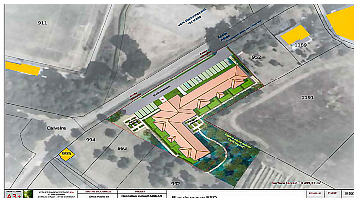
Situation à l'entrée d'Aignan (document de l'architecte)

Toilettes pour personnes à mobilité réduite : 5,93 m 2 .