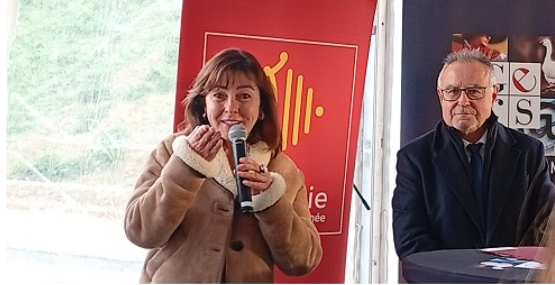
Chantier de mise à 2x2 voies de la RD1124 entre Gimont et L'Isle-Jourdain : ouverture début 2027