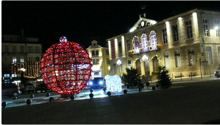
Noël illumine la ville

De nombreuses animations sont prévues du 10 au 24 décembre