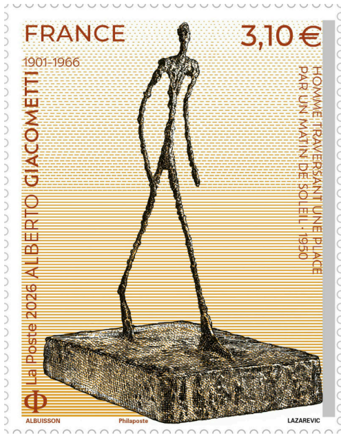
1126051 TP_ALBERTO GIACOMETTI.jpg