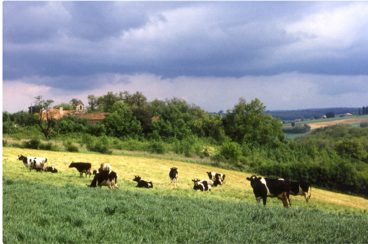
DNC : Renforcement des mesures face à l'évolution de la situation sanitaire en Occitanie