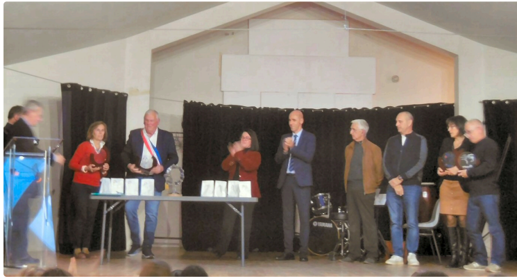
" Liberté, Egalité, Fraternité et.....Laïcité " , désormais ce slogan pour les élèves des quatre établissements de la ville

Une belle implication dans le cadre de la Commission Municipale Laïque