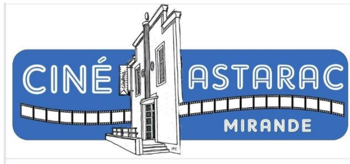
Une séance gratuite