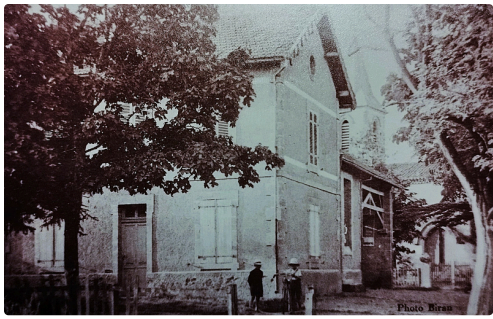
Photo Maison Ecole Castex.jpg