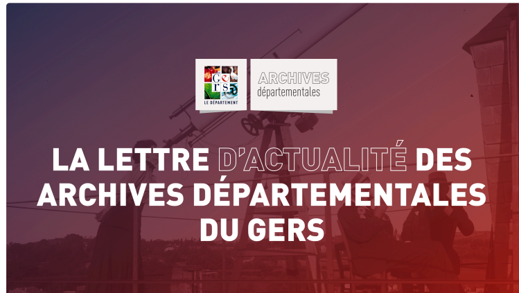
Nouvel agenda des Archives départementales du Gers

Les Archives départementales sont heureuses de vous présenter nouvel agenda culturel (janvier-juin 2026), placé sous le signe des récits sensibles et des découvertes citoyennes.