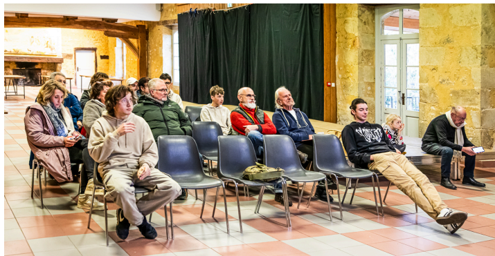
L'assistance à l'assemblée générale