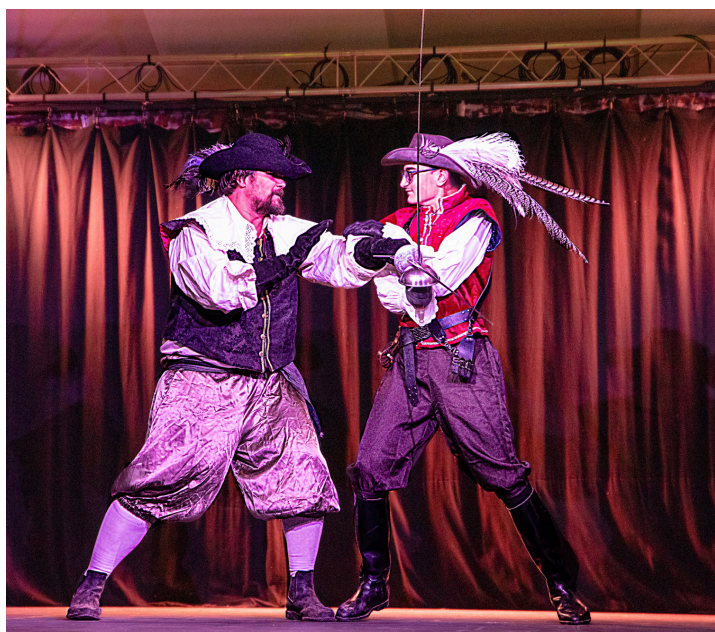
Duel dans un spectacle de cape et d'épée