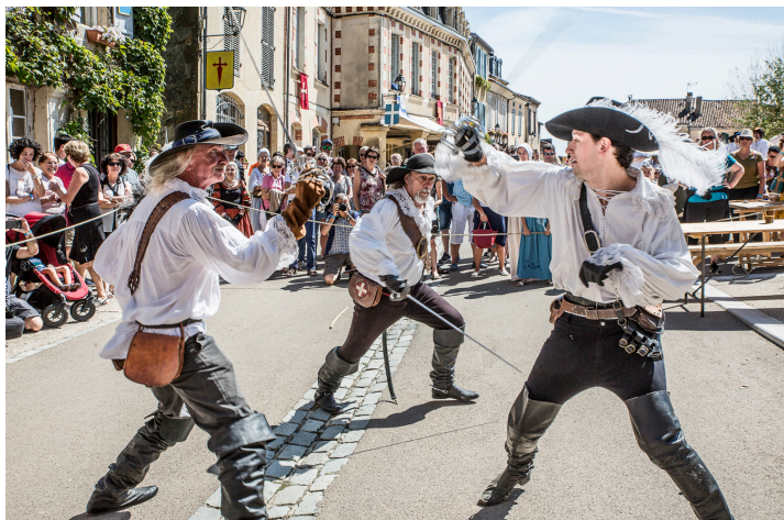
Duel pendant le Festival d'Artagnan