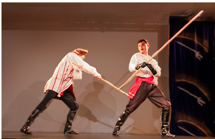
Duel au bâton dans un spectacle