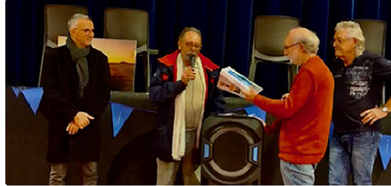
Ca roule toujours aussi bien pour les bleuets mirandais

50 ans sur la route, 50 ans dans le cœur !