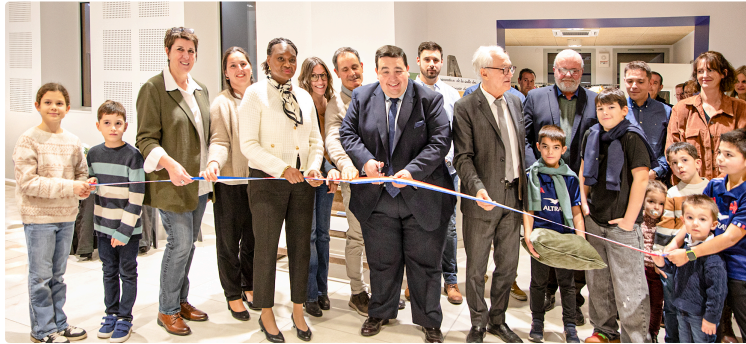
Bourrouillan : vœux 2026 du maire et inauguration de la salle des fêtes