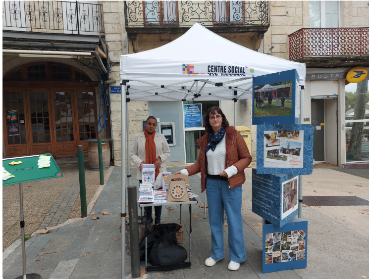
Vic-Accueil vient à votre rencontre !