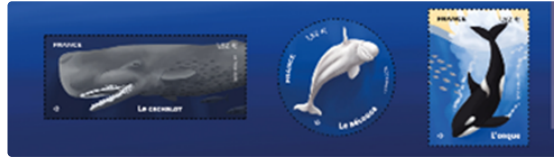
Les cétacés et la Poste

La Poste émet, dans la série Nature, un bloc de quatre timbres et un souvenir philatélique dédiés aux cétacés. Comment ne pas songer alors à Moby Dick, la plus mythique des baleines ?