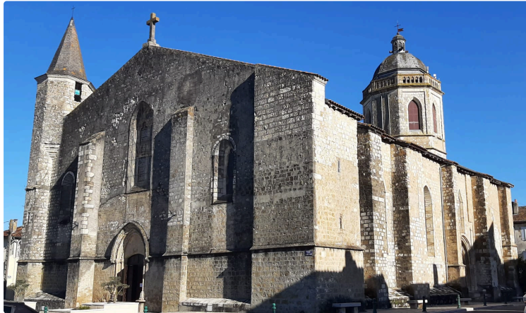
Actualités paroissiales pour le mois de février 2025