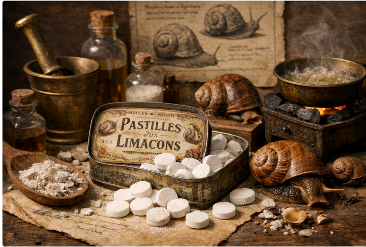
Les vertus de l'escargot de Barran, entre légende et pharmacopée gasconne

En cette fin de période hivernale, où les stocks de sirop contre la toux diminuent en pharmacie, intéressons-nous dans notre rubrique "Revenons sur nos pas" aux vertus thérapeutiques de l'escargot !