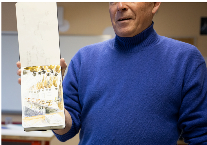
Et encore un autre !