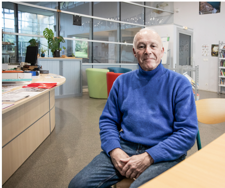
L'artiste à la salle de la bibliothèque-documentation