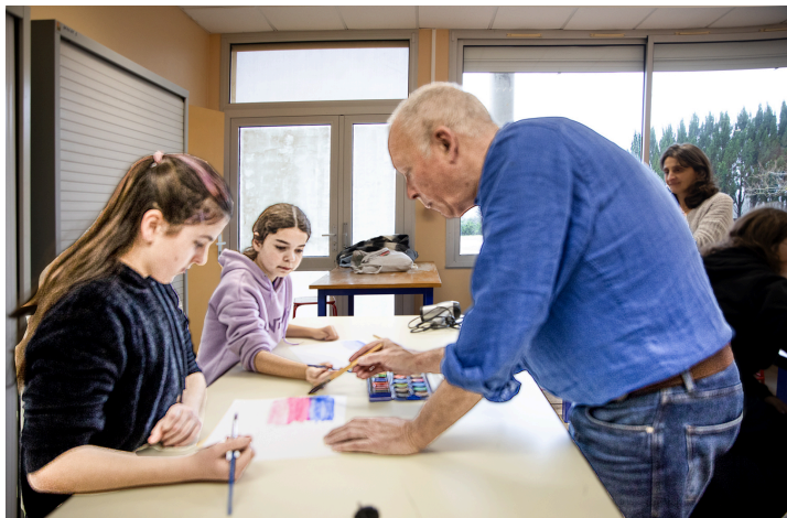
Des élèves attentives