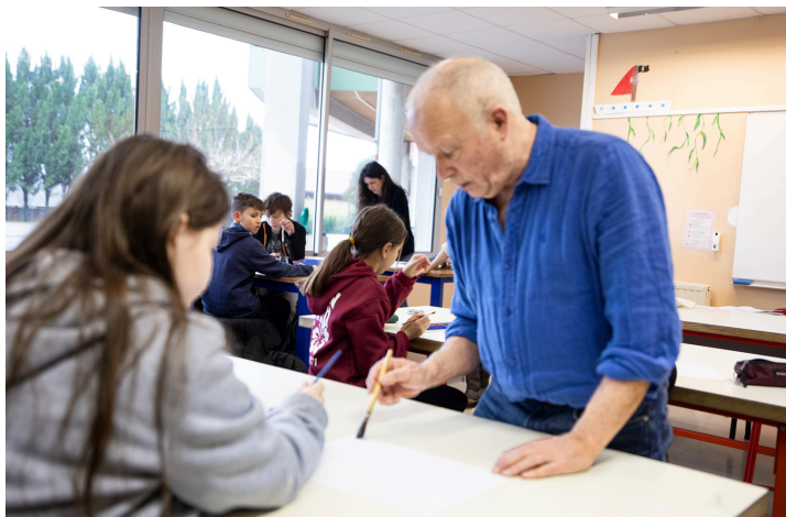
Avec une élève