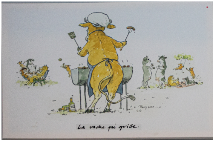
Dessin de Perry Taylor exposé au collège