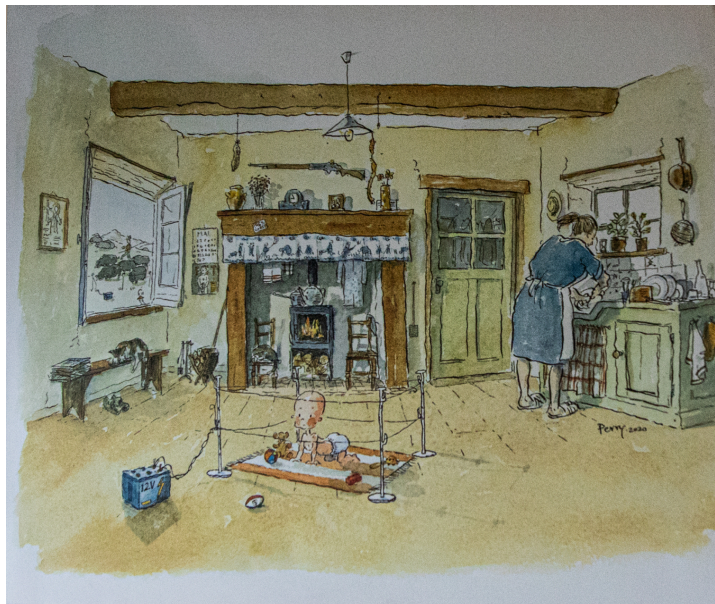
Dessin de Perry Taylor exposé au collège