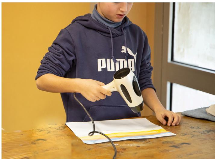
Un élève sèche son dessin