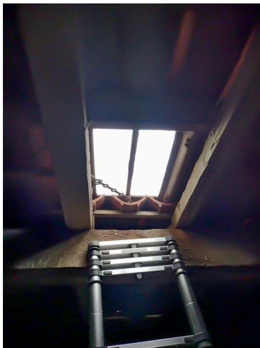
La fenêtre de toit

remplacement de nombreux points lumineux.