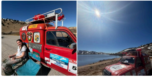
Capture d'écran 2026-02-23 191153.jpg