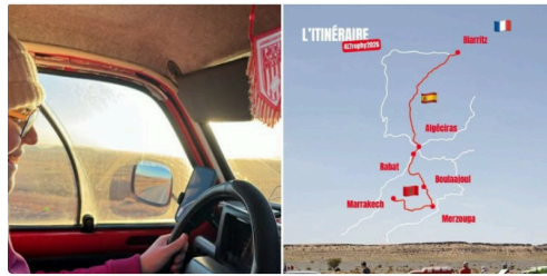
Capture d'écran 2026-02-23 191603.jpg