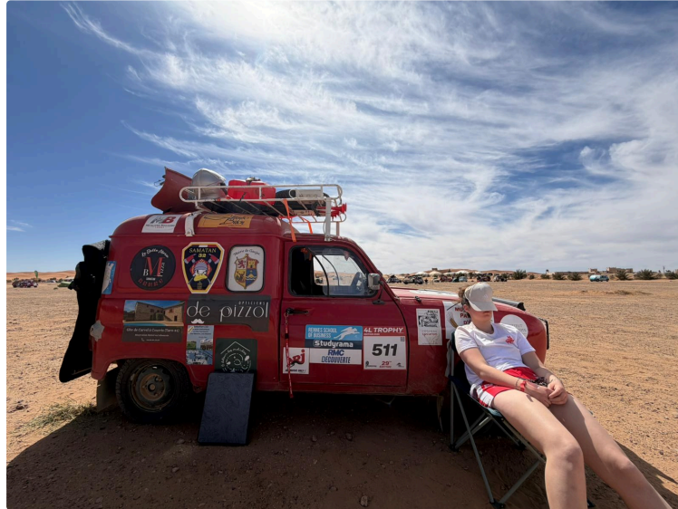
Les 4L du savès au Maroc