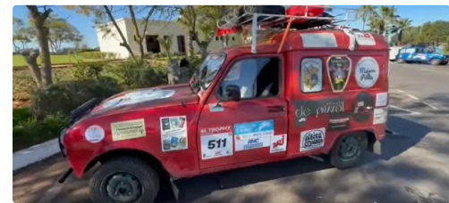
Capture d'écran 2026-02-23 190245.jpg