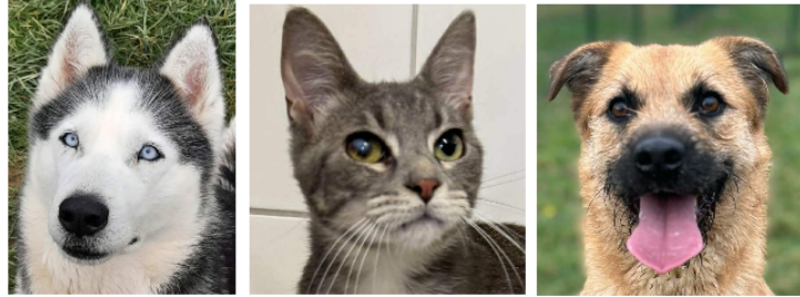
Luna, Harley et Vadi à la une de ce premier samedi de mars !

En ce premier samedi du mois de mars, la SPA nous présente une adorable demoiselle, un jeune matou et l'énergique Vadi.