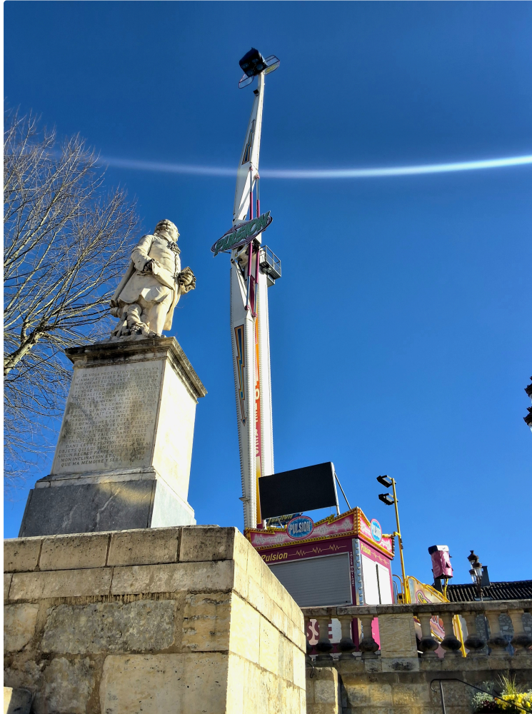
Les forains espèrent que le soleil fera le travail.

A Auch la fête foraine ouvre ses portes ce mercredi 18 mars sur les allées d'Étigny. Derrière les néons et la musique, une réalité économique moins festive.