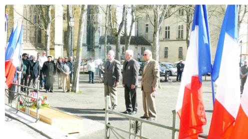
Dépôt de gerbe par la FNACA 32.