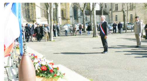
Franck Montaügé, sénateur du Gers.