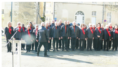
la chorale « La Serre Enchantée » de Tachaires a interprété la Marseillaise.