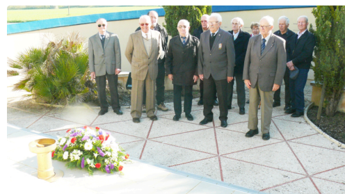
Stèle de Pavie.

La cérémonie se conclura par la sonnerie « aux Morts », une minute de silence, et par le chant de l'hymne national la Marseillaise interprétée par la chorale « La Serre Enchantée » de Tachaires. A l'issue de la cérémonie, les officiels ont salué et remercié les porte-drapeaux