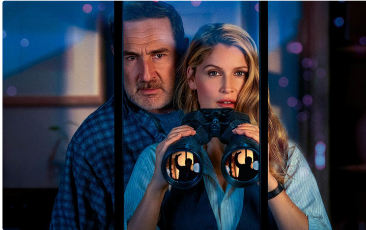
Animation, drame, thriller et comédie au programme de la semaine

Cette semaine, Cinequanon vous propose un programme varié pour petits et grands.