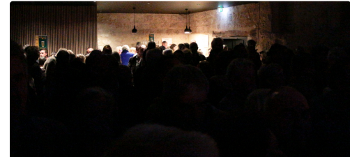
La salle était noire de monde!