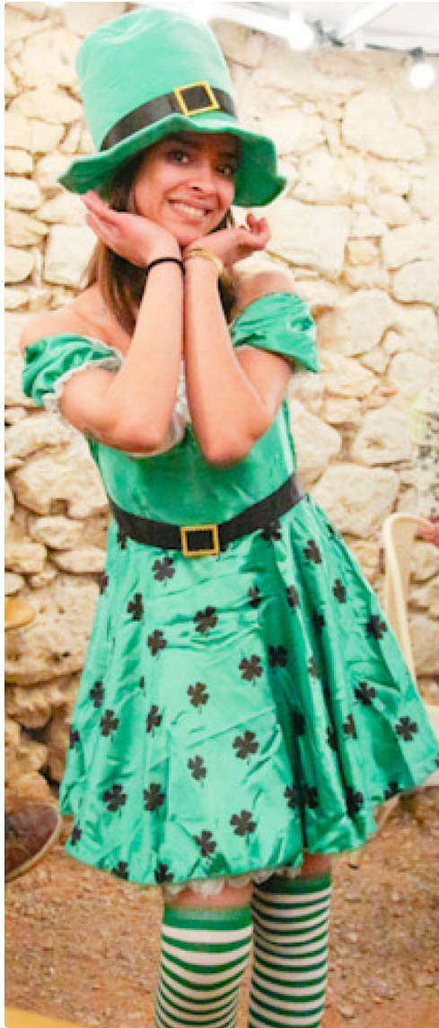
Une pure Irlandaise.