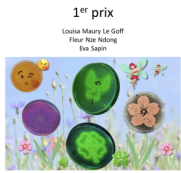
Décor Printanier 88 votes