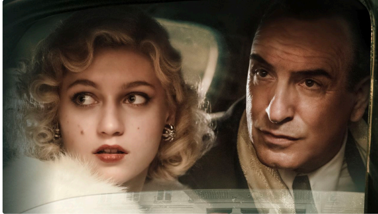
Cinequanon : ciné ruralité, drame, comédie, aventure, policier...